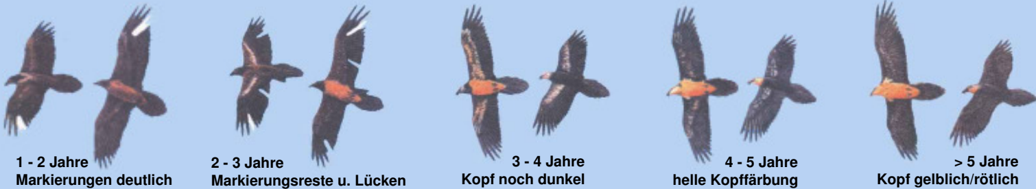
1 - 2 Jahre Markierungen deutlich

Grafiken: El Quebrantahuesos en los Pireneos (R. Heredia y B. Heredia); Ministerio de Agricultura Pesca y Alimentación. Publicaciones del Instituto Nacional para la Conservación de la Naturaleza, 1991